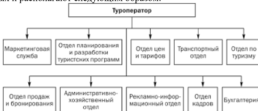
Рисунок 2 – Структура управления

Слово «Рисунок» и наименование помещают после пояснительных данных и располагают следующим образом: